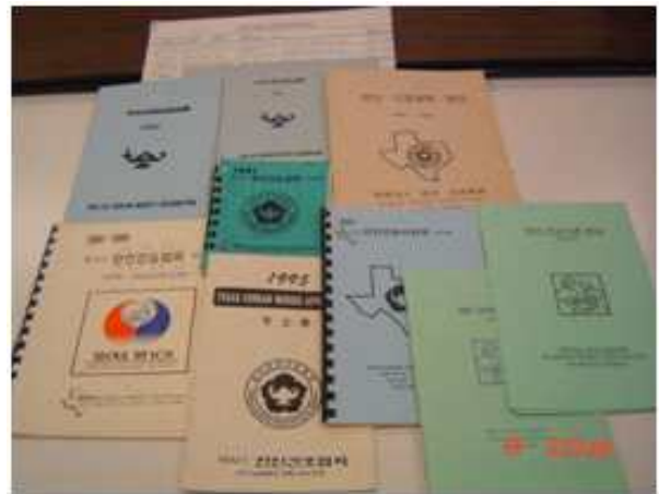
〈Figure 2〉 Directories-North Texas Korean American Nurses

북 텍사스 한인간호사회 회원들은 지역 한인교민들의 복지, 건강, 교육, 교민들간의 결속, 의료 봉사, 국내의 간호계 발전을 위한 후원, 교육 및 출판 등의 매우 다양한 활동을 펼쳤다. 의료봉사 활동으로서는 한인회 행사에서 응급처치 봉사(American Korean Immigrant History, 2005; Dallas Korean Nurses, 1983)와 예방접종 및 건강검진을 시행하였다. 또한 한인들이 미국 내 의료기관을 이용하는데 필요한 정보를 제공하고 병원에 입원한 한인환자를 위한 통역 및 교통편을 제공하는 자원봉사를 하여 왔다. 특히 독감 예방주사 접종, 그리고 한인 여성들의 유방암 예방 및 조기 발견을 위한 무료 Mammogram 검사와 한인 남성들을 대상으로 한 전립선 암 예방을 위한 검사를 매년 실시하여 그동안 100-300여 명의 한인들이 혜택을 받았다(Benefits of