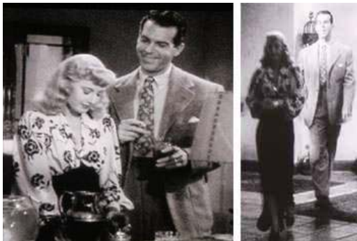
<그림 7> 여성성을 강조한 팜므 파탈 -<이중배상(1944)>

필리스의 블라우스 위에 그려진 유연한 장식적 패턴물은 남자 주인공과의 벵타이에도 같이 연출되어 코디네이션 됨으로서 여성과 남성의 성적 합일을 드러내고 있으며 또한 식물의 줄기나 꽃의 문양으로 연출되는 유동적 형태미로 남성이 비극적 사랑에 빠지는 환상을 표현하고 있다<그림 7>.