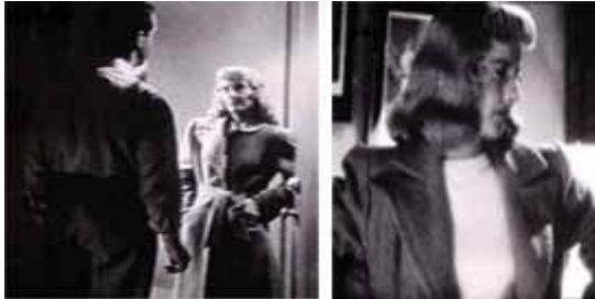
<그림 9> 권력적 팜므 파탈 -<이중배상(1944)>