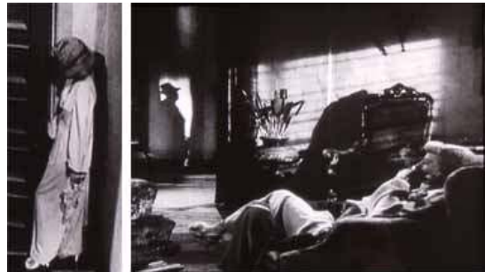
<그림 6> 左, 右> 필리스의 죽음의 예고 -<이중배상(1944)>

필리스가 죽어가는 마지막 모습으로 네프에 의해 복수의 죽임을 당하는 필리스를 연출하기 위해 하이앵글(high angle) 기법으로 위에서 샷을 처리함으로써 남성에게 의해 지배받는 여성 그리고 마지막 죽음의 길을 예고하고 있으며<그림 6左>, 샷 대부분이 어둡고 한부분만 밝은 명암대조(chiaroscuro) 조명방법을 이용한 <그림 6右>는 네프를 ‘죽음의 검은 그림자’로 상징하고 있다. 반면 죽음을 당하는 필리스는 그림자의 어두움으로 빛과 대조되게 연출하고 있다.