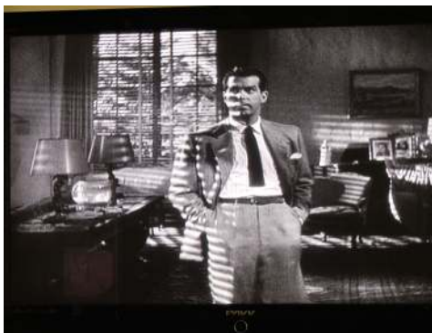
<그림 2> 비극적 남자주인공 네프 - <이중배상(1944)>

예고되지 않은 네프의 미래는 '팜 파탈'을 만나는 장소인 공허한 거실의 블라인드 조명이 거실의 넓은 벽과 소파 등에 비침으로서 네프의 비극적 앞날을 예고하고 있다<그림 2>. 빌리 와일더는 이러한 조명 효과를 매우 잘 활용하였는데 조명에 의한 가로 줄무늬의 효과를 신체 위에 드리우게 함으로서 빛에 의해 가로 스트라이프의 문양을 그려 넣은 효과를 가져 왔으며, 사선이나 기하학적 형태로 등이나 가슴 위로 쏟아지는 그림자에 의한 스트라이프 무늬의 조명의 음영은 네프의 얼굴과 몸 전체에 그물처럼 그려져 예측 불가능한 미래, 살인에 대한 불안감과 두려움, 고뇌 등을 주로 그리는데 이용되었다.