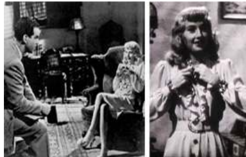
<그림 8> 순수를 가장한 팜므파탈 -<이중배상(1944)>

리스는 가슴의 프릴 장식과 목까지 올라오는 원피스를 착용함으로써 성처녀와 같은 순수함의 자아도취적 만족감을 드러내지만 거울을 통해 또 다른 필리스를 보여줌으로서 자기소외를 반영하고 있으며 연출된 순수함의 허구성과 악의적 모습을 가린 기만적 여성을 상징하고 있다. 반면 어두운 조명과 대조되는 광채로 빛나는 액세서리로 볼드한 브레슬릿, 알이 큰 반지와 함께 가슴 앞에서 스커트 밑단까지 내려오는 커다란 장식적 단추들은 순수성과는 다른 숨겨진 탐욕스러운 욕망을 상징하고 있다<그림 8>.