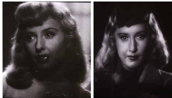
<그림 3> 팜파탈의 이중적 표정 - <이중배상(1944)>

또한 파라마운트 조명으로 반짝이는 눈, 글리터리한 입술의 부각과 금발의 웨이브 효과는 더욱 '팜 파탈'의 이미지를 그려내는데 효과적이었다. 조명은 가녀리고 고혹적 눈빛과 남편에게 억압받는 거짓의 얼굴로 네프로 하여금 살인을 모의케 하는 유혹의 눈빛을 부각시키는가 하면, 필리스가 네프와 함께 남편을 살해하는 장면에서는 감정의 흐트러짐이 없는 무표정한 얼굴 위에 파라마운트 조명으로 부각된 반짝이는 눈과 입술과는 대조되는 이마 윗부분을 가린 어두운 조명(low key) 37) 으로 여성성에 반대되는 남성적 턱을 두드러지게 연출함으로써 목적을 실현시킨 결연한 이중적 팜 파탈을 표현하고 있다<그림 3>.