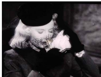
<그림 11> 그로테스크한 팜므파탈 -<이중배상(1944)>

소재와 패턴의 측면에서 보면 투명한 툴이나 쉬폰의 사용, 흰 손수건은 순수성과 정결함을, 또한 사회적으로 비도덕적 행위에 대한 비판과 사회적 악의 세계에 대한 금기시를 의미하고 있다면 그와 대비된 검은 색의 필박스와 자수 패턴물의 툴 등은 남편을 살해한 사실이 발각될 것에 대한 두려움과 자신의 불안한 내면을 가리고자 하는 혼란스러운 감정의 상태를 보여주고 있다. 시스루의 툴은 고혹적 관능미를 연출함으로써 그로테스크한 '팜므 파탈'을 한층 더 강조하고 있다<그림 11>.