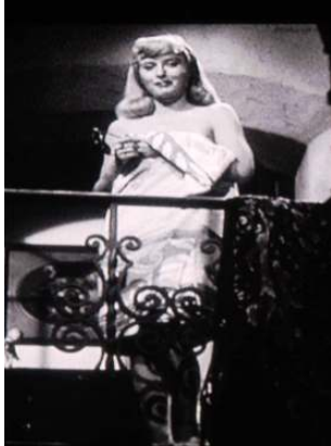
<그림 1> 팜파탈의 등장 - <이중배상(1944)>

예고되지 않은 네프의 미래는 '팜 파탈'을 만나는 장소인 공허한 거실의 블라인드 조명이 거실의 넓은 벽과 소파 등에 비침으로서 네프의 비극적 앞날을 예고하고 있다<그림 2>. 빌리 와일더는 이러한 조명 효과를 매우 잘 활용하였는데 조명에 의한 가로 줄무늬의 효과를 신체 위에 드리우게 함으로서 빛에 의해 가로 스트라이프의 문양을 그려 넣은 효과를 가져 왔으며, 사선이나 기하학적 형태로 등이나 가슴 위로 쏟아지는 그림자에 의한 스트라이프 무늬의 조명의 음영은 네프의 얼굴과 몸 전체에 그물처럼 그려져 예측 불가능한 미래, 살인에 대한 불안감과 두려움, 고뇌 등을 주로 그리는데 이용되었다.