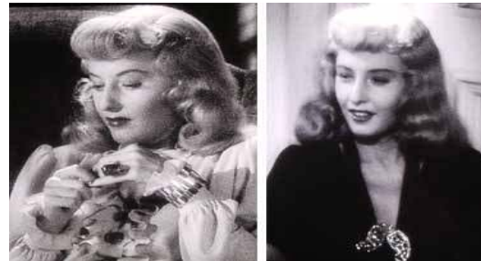
<그림 13> 볼드한 액세서리의 착용 -<이중배상(1944)>

또한 깃털이나 봉봉(bonbon) 등으로 장식된 구두는 어린 순수성, 순진무구함을 그리는데 쓰이며 이것이 남성과 관련될 때 성적인 것을 상징하기도 한다<그림 14>.