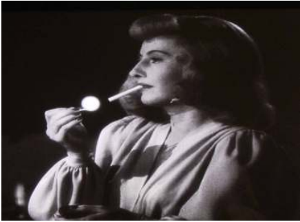
<그림 4> 폭력적 팜므파탈 -<이중배상(1944)>

않는 소품으로 비도덕적인 육감성을 표현하며 권위와 같은 폭력적인 아이콘을 상징한다. 영화<이중배상>에서 음울한 분위기를 전달하는 담배는 뛰어난 담배연기와 함께 담배 피우는 장면을 등장시켜 삭막하고 냉소적인 모습을 연출하였다<그림 4>.