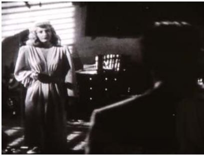
<그림 12> 구원의 성처녀로서의 팜파탈 - <이중배상(1944)>

필리스는 가슴에 슬래쉬가 깊게 파인 네크라인과 어깨로부터 허리로 떨어지는 부드러운 드레퍼리로 글래머러스함을 강조하기도 하지만 조명 효과로 인해 드레퍼리의 음영이 확연히 드러냄으로서 느와르 영화의 특징을 시각적으로 전달할 뿐 아니라 마지막 시퀀스의 대사와 그리스 여신을 연상케하는 드레퍼리의 조합은 자신의 과오를 인정함으로서 순수한 순간으로 돌아가 구원의 성처녀와 같은 마지막 동정심을 관객으로 하여금 들게 한다<그림 12>.