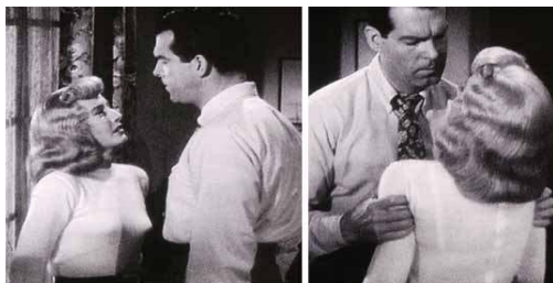
<그림 10> 관능적 팜므파탈 -<이중배상(1944)>

몸에 밀착된 의상 스타일을 연출하여 관능미를 나타내고 있다. 저지나 니트는 드레이프 성이 강한 특성으로 인해 몸의 형태를 더욱 극명하게 드러냄으로서 관능적미를 드러내고 있다. 반면 목을 가리는 네크라인의 형태나 백색의 색상은 정숙한 여인과 남편에게 핍박받는 가녀린 여성을 연출함으로써 네프로 하여금 폭력적 남편으로 부터 필리스를 구원하고픈 욕구가 들도록 연출하고 있다. 또한 네프를 유혹하기 위해서 착용한 패스너(fastener)가 달린 스웨터는 콘 브라의 착용을 더욱 강조하여 자신의 간계를 감추어 계락을 성공시키기 위한 유혹적이며 관능적 '팜므 파탈'을 보여주고 있다<그림 10>.