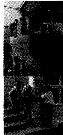
<그림 3> 아폴로 학교 (Apollo School)

네덜란드의 지역사회학교는 정규교육에 비정규교육 시스템을 도입하여 단절된 교육이 아닌 학생들 스스로가 자기계발을 하는 기회를 가지게 하고 외부 비 교직 인력을 통하여 학생에 대한 부모와의 대화를 만들어 가게 된다. 그래서 교육공간은 사회참여를 증대하고 학교 중심으로 지역사회와의 발전을 도모하며 응집력을 높여가는 곳이다. 즉, 사회와 연계되려는 비 정규 교육시스템 역시도 중요한 역할과 기능을 담당한다.