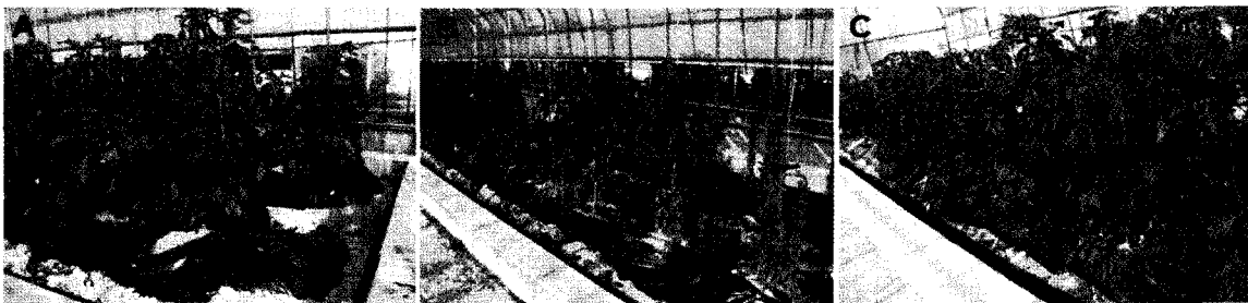
Fig. 1. Copper hydroxide may be effective to control of Bacterial wilt caused by Ralstonia solanacearum on tomato seedlings. A, non-inoculated; B, inoculated; C, Copper hydroxide treated.

c) means within rows followed by the same letter do not differ significantly at 5% level by DMRT ( P<0.05 )