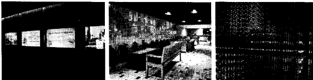
a) 디스플레이 b) 프로젝션 미디어 c) LED

홀로그램, Data Glove, Pin, 모바일 디바이스 등 특수 미디어를 통해 관람객에게 새로운 경험을 제공하고, 디지털 사이니지와 연동을 통해 효과를 더욱 극대화시킬 수 있다.