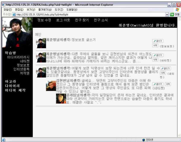
(그림 2) 웹 화면

보호보 학습에는 같은 주제의 다른 관점이 있는 미디어를 두어 미디어를 비판할 수 있게 미디어리터러시를 적용하였다. 비판에 대한 생각이 옳고 그런지에 대한 판단은 아고라의 토론과 교수자의 피드백을 통해 이루어지도록 하였다.