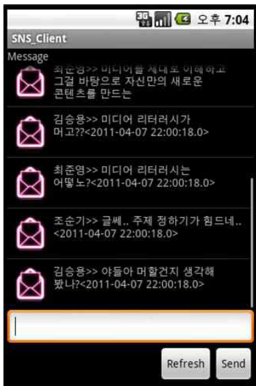
(그림 3) 의견교환 및 문제해결 화면

기존의 SNS 서비스와 동일하게 글이 올라오는 동시에 동료 학습자 또는 교수자가 답글을 달수 있고 피드백이 실