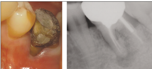
Figure 1. Preoperative clinical photograph and radiograph : Buccal surface of mesial root is exposed due to severe gingival recession. Periapical radiograph revealed periapical radiolucency around mesial root of #36.

메틸렌 블루의 효과적인 염색을 위해 노출된 치근 표면을 3-way 시린지로 건조시켰고 메틸렌블루 용액을 적용하였다(Figure 2). 하지만 주변 조직으로부터 나오는 치은열구 삼출액과 출혈이 시야를 흐리게 만들었고 다시 건조 및 염색을 시행하였다. 이러한 과정이 수차례 반복되었는데, 갑자기 환자가 얼굴이 붓는 것 같다고 호소하였다. 안모 관찰 결과, 좌측 협부와 안와 하부에 갑작스러운 부종이 나타난 상태였으며 구강 내 관찰 시 하악 좌측 제1대구치의 협착 전정부에도 부종이 나타나 있었다(Figure 3). 구강 외 부종