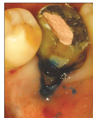
Figure 3. Methylene blue staining procedure.

연세대학교 치과대학병원 보존과에서 수년 전에 발생한 유사한 증례에서도 치은 퇴축에 의해 부착 치은이 매우 얇게 남은 것을 관찰할 수 있다. 이 증례에서는 5급 외동 수복