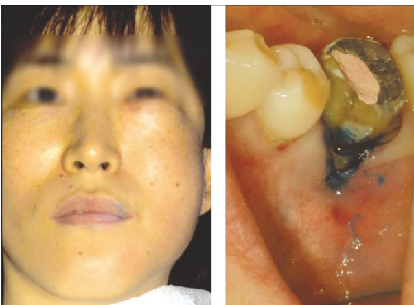
Figure 2. Extraoral and intraoral photographs after onset of subcutaneous emphysema : Sudden onset of swelling on left infraorbital, buccal, vestibular area.

이 나타난 부위를 촉진 시 염발음을 들을 수 있었으며 통증, 발열, 발적, 림프절증 및 기타 전신 증상은 없었다. 검사소견들을 토대로 피하기종으로 진단 하였으며 일주일간 항생제 및 진통제 복용을 지시하였다. 일주일 후 검진 시, 부종은 모두 가라앉은 상태였고 환자도 2 - 3일 지나면서 부었던 것이 다 가라앉았다고 하였다.