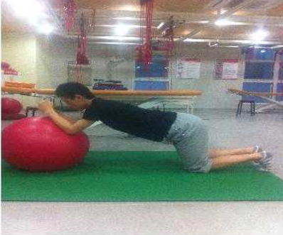
Fig 1. Gymball exercise 1

세트 당 10회 3세트를 실시하였다. 운동 1회 실시 후 5초간 휴식을 하였고 세트 간에는 2분의 휴식 시간을 적용하였다(Fig 1).