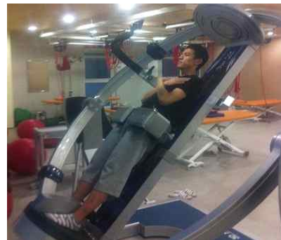
Fig 4. Muscle endurance test

배근력은 측정기기에 올라서서 대상자에 맞게 길이를 조절한 후 두 손으로 손잡이를 잡고 팔꿈치를 편 상태에서 무릎을 굽혀서 다리의 힘을 사용하지 않도록 다리를 쭉 펴서 힘껏 당긴다. 복근력은 팔꿈치와 다리를 편 상태에서 뒤로 돌아서 두 손으로 바(bar)를 잡아 허리를 약간 젖히고 배에 힘으로 당긴다. 3번 측정하여 평균값으로 하였다(Fig 5).