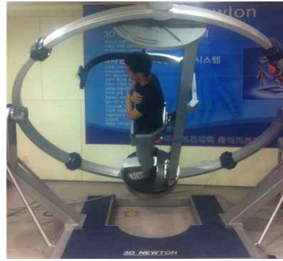
Fig 3. 3D NEWTON exercise