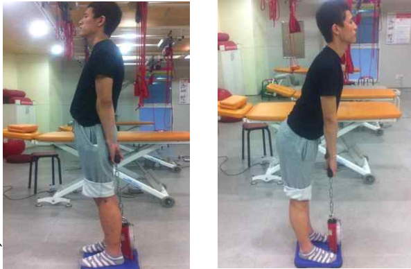
Fig 5. Muscle strength test