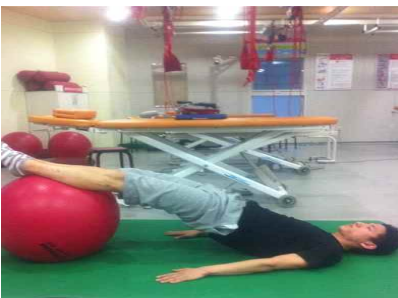
Fig 2. Gymball exercise 2

운동방법은 대상자가 차렷 자세를 유지한 상태로 골반과 대퇴를 고정한 후 손은 가슴에 얹고 동시에 턱도 chin-in)상태에서 드로우 인(draw-in)이 유지되게 하였다. 사전검사에서 3분을 유지할 수 있는 기울기 각도를 측정하여 3분 3세트를 실시하였고, 세트 간에는 2분간의 휴식시간을 적용하였다. 2주 후 무리 없이 운동이 가능하면 경사 각도를 10도 증가하여 운동을 실시하였다. 운동 시 센서화면을 켜놓은 상태로 대상자들이 센서화면을 보면서 자세를 유지할 수 있도록 하였다(Fig 3).