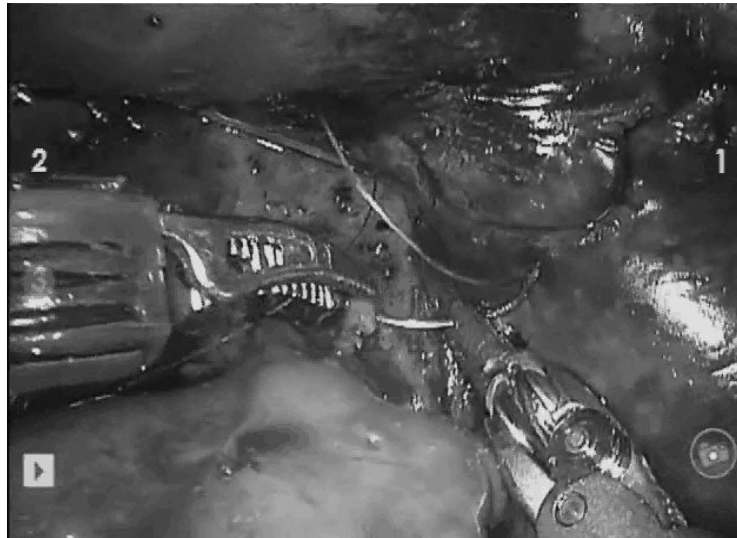
Fig. 2. Three-dimensional image of hepaticojejunostomy using robotic arms with 5-0 Vicryl interrupted sutures after resection of choledochal cyst.

트의 크기에 맞게 확장된 배꼽 절개부위를 다시 봉합하여 이산화탄소의 누출을 방지한 후 로봇을 도킹하였다. 그 후의 술식은 모두 로봇을 이용하여 체내에서 시행하였으며 초기 1예(증례 2)를 제외하고 Roux-en-Y Limb은 모두 antecolic route를 사용하여 간문맥 부위에 위치시켰다.