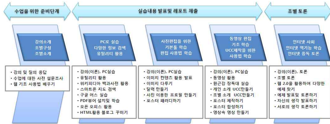
그림 1. 웹 2.0을 활용한 인터넷 활용 수업 모형도 Fig. 1. Teaching and Learning Model in the Web 2.0-based Internet Information Education

웹 2.0을 활용한 인터넷 활용 교과와 기본 수업 모형을 도식화하면 <그림 1>과 같다. 본 연구에서는 개발된 교재를 기본으로 수업 모형도를 적용하고 다음과 같은 수업 내용과 수업 방식으로 수업을 진행하였다. 수업 방식은 전체 15주의 수업 분량을 세 개의 영역으로 나누고 웹 2.0을 활용한 수업 진행을 위해 교수 학습 시스템의 설문 조사 항목을 이용하여 웹 2.0 활용에 관한 사전 설문 조사를 실시하였다.