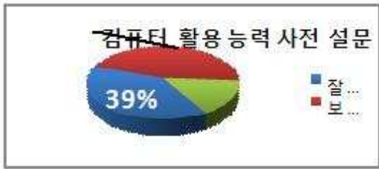
그림 2. 사전 설문 조사 Fig. 2. Pre-survey about Computer Application

이는 현재의 대학생들이 초등학교 시절부터 컴퓨터를 접하면서 자라온 컴퓨터 세대인 점을 고려하면 의외의 결과로, 초·중등학교에서의 컴퓨터 교육이 컴퓨터의 개념 이해보다는 게임이나 단순한 정보 검색 위주로 컴퓨터를 활용하고 있음을 보여주고 있다. 따라서 대학의 교양 컴퓨터 수업에서 컴퓨터의 올바른 개념 이해와 실생활에서 직접 사용 가능한 컴퓨터의 활용에 대해 올바른 교육이 필요함을 알 수 있다.