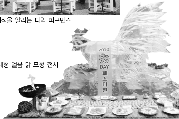
▶ 대형 얼음 닭 모형 전시