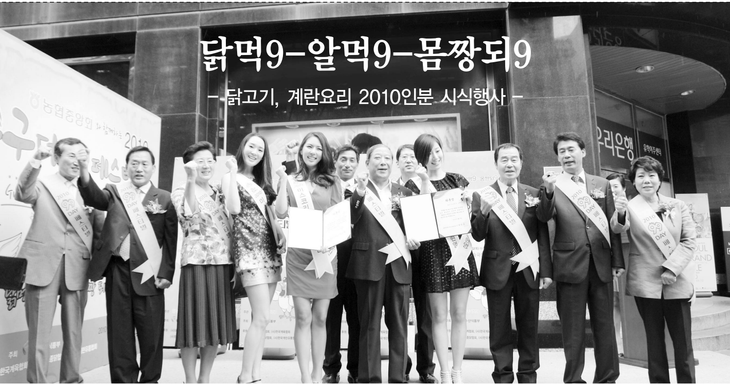
▲ 닭고기 · 계란요리 많이 먹고 몸짱됩니다! 화이팅!

지난 9월 9일 서울 명동예술극장 광장 앞에서 닭고기와 계란의 소비촉진을 위한 '2010 대한민국 구구데이' 행사가 열렸다.