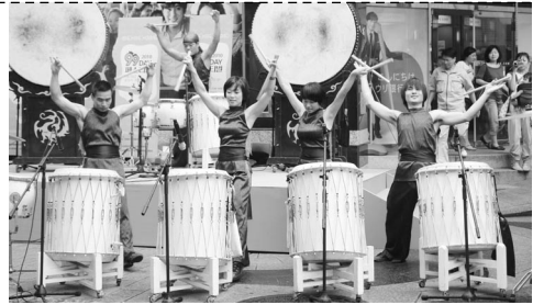
▲ 행사 시작을 알리는 타악 퍼포먼스