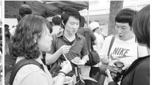
▲ 닭고기 · 계란 시식행사 이벤트로 즐거운 시민들