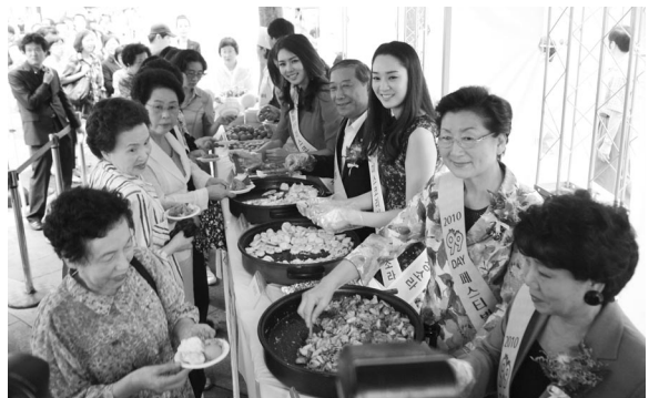
▲ 2010인분의 닭 진미전, 닭 호도볶음, 계란냉채, 계란감식초구이와 999인분의 후라이드 치킨, 999인분 구운 계란 시식행사가 진행되었다.