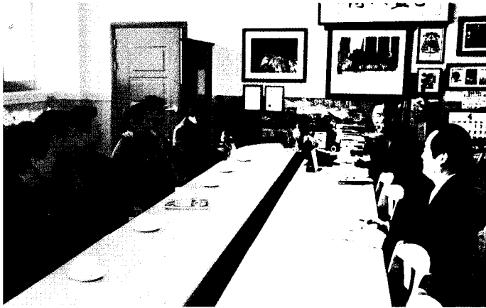
▲ 새로 선임된 지회임원들과 함께 강북구청을 방문하여 김현풍 구청장과의 대화를 하고있다.

강북 지회(송용곤 지회장)는 지난 4월 9일 새로 선임된 지회임원들과 함께 강북구청을 방문하여 김현풍 구청장과의 대화를 가졌다.