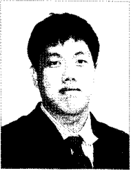
김재민 기자 축산경제신문

이 길이 맞긴 한데... 어렵긴 하다 사육밀도 조절 등 환경 개선 통한 생산성 유지에 초점