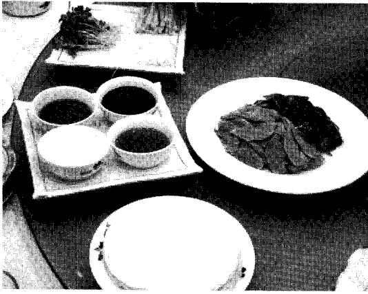
▲중국 베이징 덕