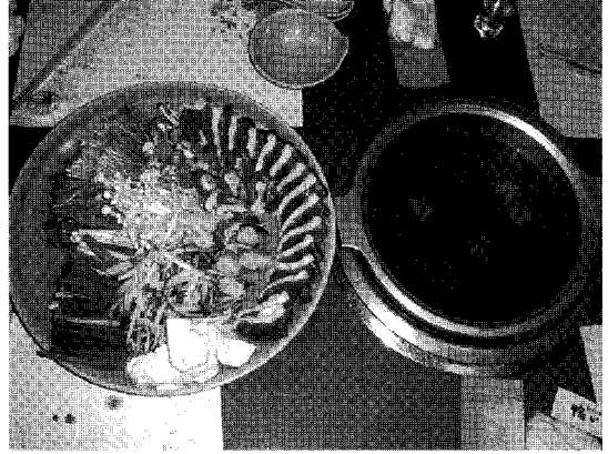
▲일본 오리남비 요리

오리고기는 AI 발생으로 소비자들의 관심을 받게 된 2003년까지만 하더라도 어르신들이나 드시는 보양식에 머물러 있었던 것이 사실이다. 당시 소비촉진을 계획하면서도 거리홍보를 하면 젊은이들이나 학생들이 기꺼이 먹어줄까 하는 의구심이 있었으니 말이다. 하지만 시기적으로도 절묘한 시점에 웰빙(Well-Being, 참살이)이라는 개념들이 본격화 되면서 오리고기가 더 각광을 받은 것으로 볼 수 있다. 국내에 웰빙이라는 개념이 시작된 것은 2001년부터 2002년 말까지라고 한다. 그 사이에 AI가 발생하여, 특히 TV 프로그램을 활용한 홍보에 치중하다보니 오리고기는 보양식뿐만 아니라 건강식이라는 인식을 심고자한 노력이 적중하였다. 더구나 2004년 7월부터 단계적으로 주5일근무제 실시가 확산된데다 온 도로변의 음식점들이 모두 오리탕집, 오리구이집으로 즐비하게 들어서 있고, 특히 통 큰 음식점들도 적잖이 볼 수 있게 되었다. 서울이나 큰 도심에서 오리고기 집을 찾기 어려운 적도 있었지만 2007~2008년 들