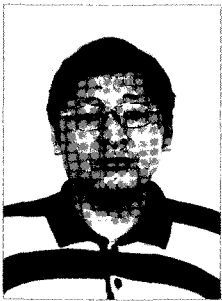
작가 | 신현배

‘쭈쭈, 용이 자기가 볼품없이 생겼다고 또 우울증에 빠져 있구나. 저 녀석은 잔칫날이 가까워 오면 늘 저렇게 생기를 잃어버리