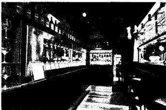
▲ 마시고 싶은 양의 버튼을 눌러 와인잔에 와인을 따르는 모습

자판기의 천국 일본에서 와인을 자판기화한 시스템을 통해 판매하는 업소가 등장했다. 정확히 말하면 와인 디스펜서(지급기)라는 명칭으로 등장한 자판기 개념의 와인 지급기는 도쿄 긴자의 한 와인Bar인 'GOSS'에 설치되어 있다. 먼저 희망하는 금액을 투입해 카드를 발급 받고, 그 카드를 이용해 자신이 마시고 싶은 와인을 선택해서 20ml, 40ml, 80ml중 양을 정해 버튼을 눌러 자신의 와인 잔에 와인을 받아 마시면 되는 기계이다. 긴자는 원래 일본에서도 와인 Bar들의 경쟁이 치열한 것으로 유명한데, 이러한 긴