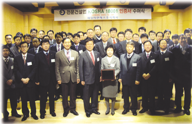
▲ 인증서 수여식 후 세일이엔에스(주) 직원들과 기념촬영

세 일이엔에스(주)(회장 정승일)가 지난해 12월 29일 한국산업안전보건공단으로부터 전문건설업 KOSHA 18001(건설안전보건경영시스템) 인증을 획득하고 지난 1월 15일 세일아트홀에서 인증서 수여식을 가졌다.