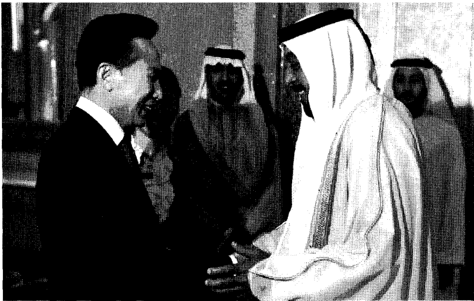
이명박 대통령과 칼리파 UAE 대통령

취할 수밖에 없다...그것은 유엔에서 프랑스어를 쓰는 20여개국을 묶어 조선민주주의 인민공화국을 지지할 것이라던 조치이며 이것은 우리 외무성, 산업성, 기타 관련 부처와 함께 내린 비장한 결의이니 당신네들은 알아서 현명하게 대처하기 바란다....”