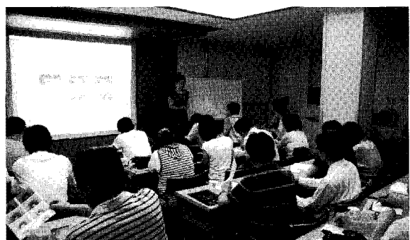
▶ 사진의 저변확대에 앞장서고 있는 세기포토스쿨에서의 사진교육 광경