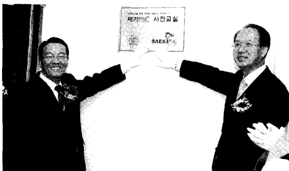
▶ 지난 11월 2일 미평여자학교(청주소년원) 사진교실 현판식 광경

한편, 일반인들은 물론, 소년원생을 위한 지원에도 꾸준히 앞장서고 있는 가운데, 고객이 가장 좋아 주는 기업이 되고픈 바람대로 꿈의 신사옥이 완공되는 날, 사진인들도 세기P&C로 인해 더욱 행복해질 것 같다.