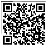
☎ "특허검색" 앱 다운로드 QR 코드 (안드로이드 마켓)