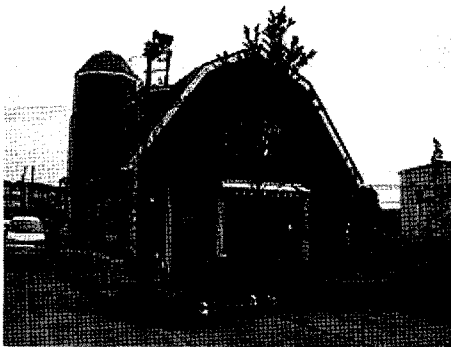
우사를 본떠 지은 아이스크림 가게

백초목장이 있는 日野시는 도쿄의 거의 중앙에 위치하고 있으며, 그 동안 기업유치나 대규모단지 개발에 의해 주택도시로서 발전을 계속해 왔다. 도시개발 이전에는 농업을 중심으로 변창한 이 도시에도 농업인의 수는 급감하여 이제는 총세대수 중 차지하는 농가세대수의 비율은 0.5%로 아주 낮으며, 이 日野시에서 이 목장 한 개만이 남아 있다. 이 목장은 목장주의 아버지가 그 동안 12~13두의 착유소를 유지하면서 경영을 하다가 2002년에 아들이 물려 받으면서 현재 19두(이중 저어지 품종 2두)를 착유하고 있다.