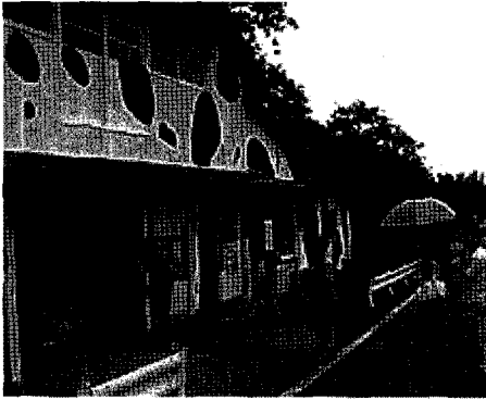
홀스타인 얼룩무늬의 우사를 구성하는 관광객

기에는 젤라토의 공헌이 아주 크다. 이 목장의 경영 수지는 낙농과 가게를 포함하는 전체적인 측면에서 보는 것이 합당하다. 가게를 가지면 낙농을 전업으로 하는 것보다 무엇을 할 것인가에 대한 발상이나 수단도 넓어지고 여유를 갖게 함으로서 2개의 기둥(낙농과 유제품가공판매)이 이 목장을 잘 버텨 주고 있는 것이다.