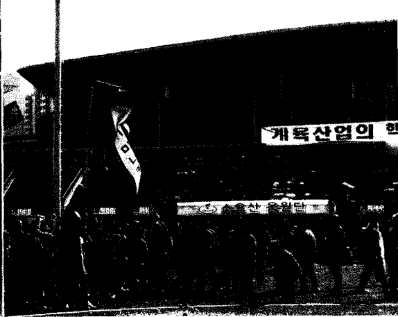
이번 행사의 슬로건이 적힌 대형 애드벌룬에서 마니카의 의지를 엿볼 수 있다.