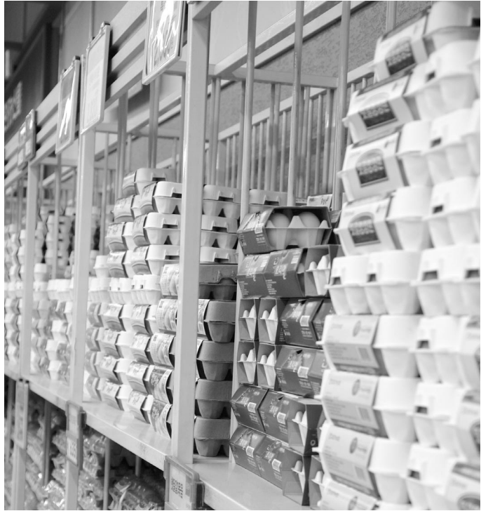
표4. 지역별 계란의 유통비용