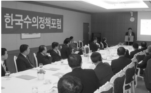
제29차 한국 수의정책포럼