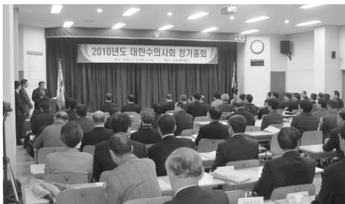
2010년도 제1차 대한수의사회 정기총회

2부에서는 2009년도 정기총회 의사록 접수(안), 정기감사보고(감사 : 김창렬, 장묘성), 의안심의 순으로 진행되었으며 의안심의를 정영채회장(의장)의 진행으로 2009년 사업실적 및 수입·지출 결산(안), 2010년 사업계획 및 수입·지출 예산(안), 대한수의사회 정관 일부 개정(안)을 안건으로 다루었다.