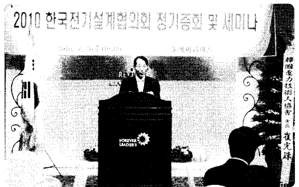
전기설계협의회 정기총회 및 세미나 개최