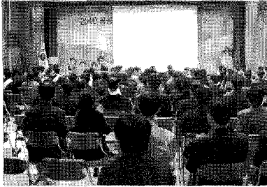
생활에너지 절약을 선도하고 저탄소 녹색성장의 국가정책에 적극 앞장서 나가고자 공공기관 에너지 절약을 위한 다짐대회