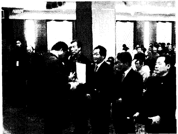
▲ 표창패 수상자