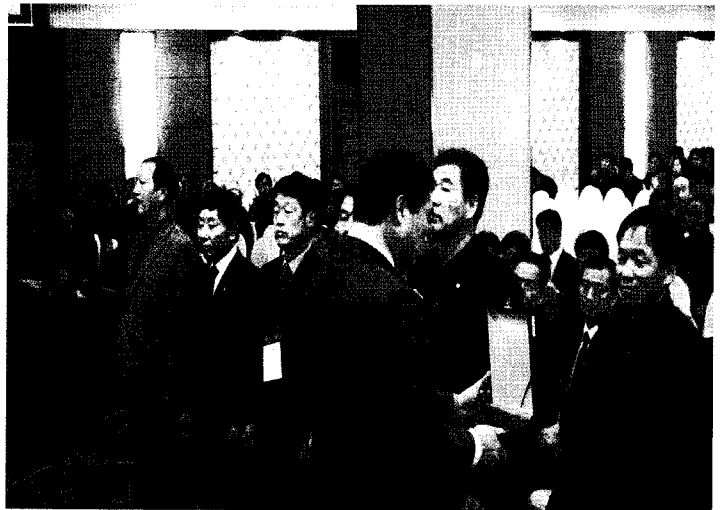
▲ 본협 제 15대 前 임원 재직기념패 전달