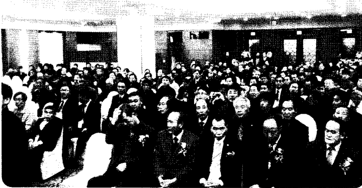
▲ 회의를 가득 메운 양봉협 회원