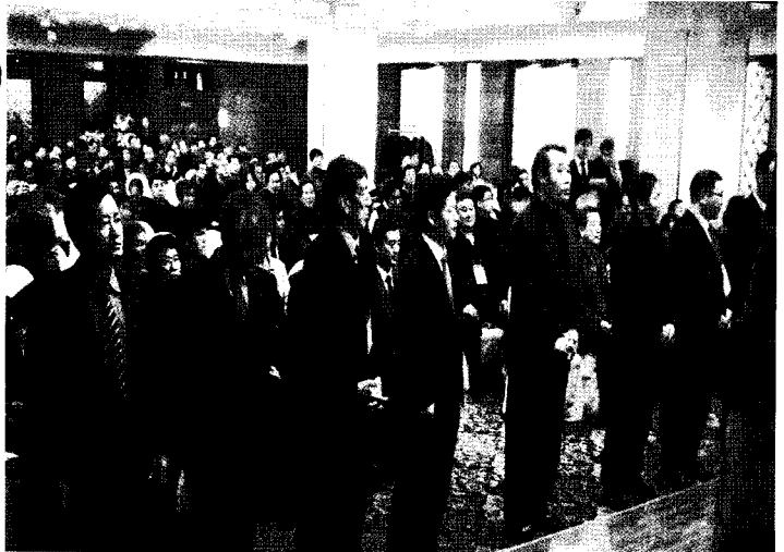
▲ 농림수산식품부 장관표창 수상자