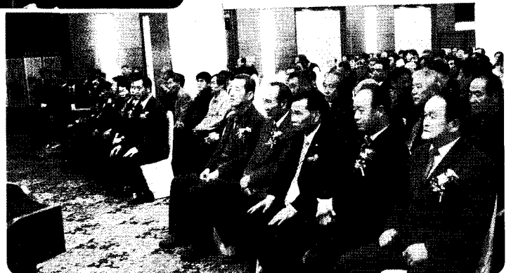
▲ 양봉협 현 임원진, 前 임원진 일동