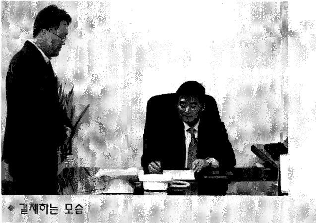
◆ 결재하는 모습