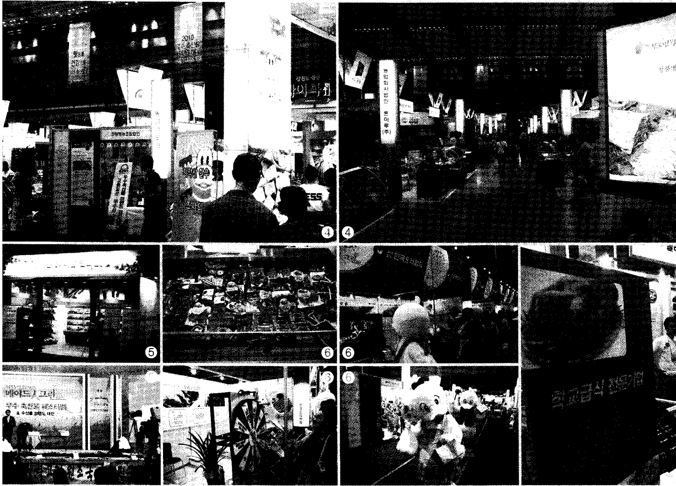
④전시장 모습 ⑤다양한 이벤트가 진행되었다. ⑥협회에서 진행한 룰렛 이벤트 및 오리제품 전시 모습

서 소비자들에 오리고기를 효과적으로 홍보할 수 있는 자리였다고 평가된다. 부스를 찾은 관람객들은 “생각보다 다양한 오리제품이 존재한다”고 말하면서 “브랜드도 다양해서 굉장히 놀랐다”고 감탄했다. 협회에서 제작한 오리탈에 대한 반응도 매우 좋았다. 남녀 한쌍으로 제작된 오리탈과 함께 사진을 찍으려는 사람들도 많았고, 특히 호기심 많은 아이들이 큰 관심을 보이기도 했다. 행사 3일간 협회에서는 자체 이벤트인 오리제품 교환권 나눔 룰렛 이벤트를 진행하였는데, 오리고기를 할인받아 구매할 수 있는 할인권으로서 오리고기를 구매를 원하는 관람객들에게 큰 인기였다. 한 이벤트 참가자는 “평소 오리고기를 좋아하는데, 이렇게 할인을 받아 구매할 수 있어서 좋다”고 소감을 전했다. 또한 홍보영상