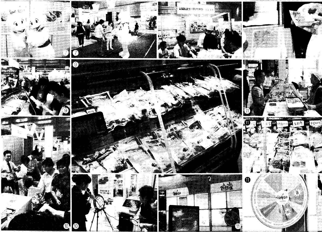
●협회에서 제작한 오리탈은 많은 사람들의 이목을 끌었다. ●(주)이목원의 훈제오리밀전병 시식 모습 ●(주)주원산오리의 부스와 제품 전시 ●(주)모란식품은 닥트 이벤트를 진행했다. ●(주)코리아더커드는 시식 및 닥트 이벤트를 실시하였다.

식을 통하여 아이들에서부터 장년층 입맛까지 사로잡았으며, (주)주원산오리는 신제품 레몬속성 안심 오리 훈제 슬라이스를 홍보하는 한편, 오리 훈제 및 동그랑땡 등을 시식할 수 있는 자리가 마련되었다. (주)이목원은 특별히 배나무골 코스요리 중 하나인 훈제오리밀전병 시식을 진행하였는데, 밀전병 안에 훈제오리와 고추피클이 들어가 정성스레 만들어진 덕분에 시식을 한 이들에게 좋은 반응을 이끌었다. 독립부스로 참가한 (주)코리아더커드는 닥트 이벤트와 시식 행사로 참관객들의 관심을 모았는데, 훈제슬라이스 및 떡갈비, 다향 e-shop 적립금 쿠폰을 이벤트 참가자들에게 나눠주는 행사를 진행하는 한편 시식을 통한 브랜드 홍보에 주력하였다.