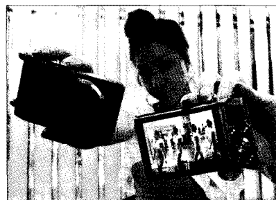
▶ 파노라마 액션기능이 탑재된 삼성블루 WB2000

며 노이즈도 큰 폭으로 감소했다. 두께는 21mm로 슬림한 사이즈며 24mm 초광각 5배 광학줌 렌즈가 탑재됐다. 풀사이즈 듀얼 캡처 기능으로 동영상 촬영 중 사진 촬영 모드 변환 없이 셔터만 누르면 최대 1000만 화소급 사진촬영이 가능하다. 또 촬영된 동영상을 재생하다가 마음에 드는 장면은 캡처해 사진파일로 저장할 수 있다. 이외에도 한 단계 발전한 파노라마 액션 촬영 기능이 얹혔다. 지금까지의 파노라마 기능은 주로 정지된 화면을 촬영하는데 활용됐지만 WB2000의 파노라마 액션 기능은 움직이는 물체의 움직임을 따라가며 촬영한 다음 저장할 수 있다. 이 기능은 삼성이 세계 최초로 카메라에 구현한 기능이다. 신제품 WB2000의 색상의 출고가격은 42만9000원이다.