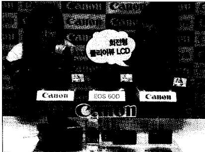
▶ 캐논코리아컨슈머이미징이 지난 8월 26일 서울 프레젠테이션에서 신제품 10종을 발표했다.

캐논코리아컨슈머이미징(대표·강동환)은 회전형 LCD 창을 갖춘 DSLR 카메라 'EOS 60D'와 렌즈 6종, 콤팩트카메라 2종, 포토 프린터 등 하반기 신제품 10종을 출시했다. 캐논 EOS 60D는 캐논 DSLR 카메라 최초로 회전형 LCD를 통해 앵글에 구애 없이 피사체를 촬영할 수 있고, 풀HD급 동영상 촬영을 할 수 있다. 캐논 콤팩트카메라 신제품 2종(파워샷 S95, 익서스 1000HS)은 노이즈와 흔들림을 줄여주고 피사체를 섬세하게 표현해주는 HS 시스템을 탑재한 게 특징이다.