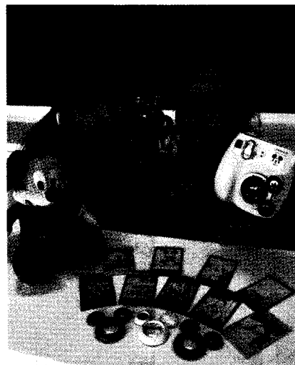
▶ 한국후지필름에서 선보인 즉석카메라용 '인스탁스 미키 접사렌즈'와 개성 있는 사진 연출이 가능한 '인스탁스 미니 컬러풀 필름'

한국후지필름(대표·이창균)은 즉석카메라용 '인스탁스 미키 접사렌즈'와 개성 있는 사진 연출이 가능한 '인스탁스 미니 컬러풀 필름'을 출시한다고 밝혔다.