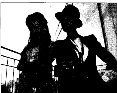
▶ 후지필름에서 선보인 초고속 자동초점 디카

한국후지필름(대표·이창균)은 자동초점 속도를 개선한 파인픽스 디지털 카메라 'F300EXR'와 'Z800EXR'을 출시한다고 밝혔다. 이번 신제품은 DSLR에서나 가능했던 위상차AF를 실현해 피사체가 빠르게 움직이는 순간에도 정확한 촬영이 가능하다.