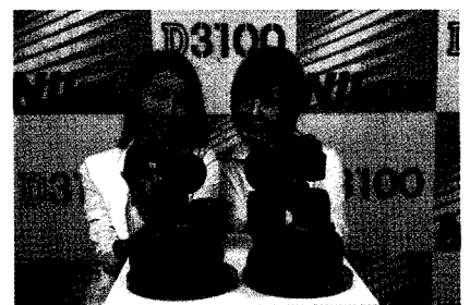
▶ 니콘에서 새롭게 선보인 DSLR 카메라와 렌즈 신제품

D3100은 다무비 기능을 탑재해 초당 24프레임의 영상을 최대 10분까지 연속 촬영할 수 있다. 또 상황에 따라 카메라 설정을 쉽게 바꿀 수 있도록 가이드 모드 기능을 강화했고 새로운 화상처리엔진 엑스피드2 기능을 채택해 사진의 색감을 개선했다. 니콘은 'AF-S NIKKOR 85mm F1.4 G', 'AF-S NIKKOR 28-300mm F3.5-5.6G ED VR', 'AF-S NIKKOR 24-120mm F4G ED VR', 'AF-S DX NIKKOR 55-300mm F4.5-5.6G ED VR' 등 렌즈 4종도 함께 출시했다.