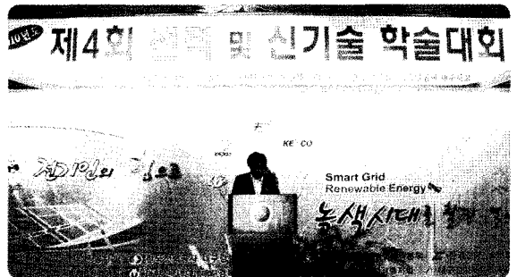
제4회 전력 및 신기술 학술대회