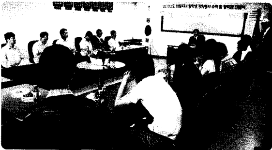
회원자녀 장학생 장학증서 수여 및 장학금 전달식