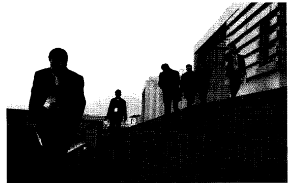
• 경기도 아파트 품질평가단이 아파트 옥사의 지붕에까지 올라 점검을 하고 있다.