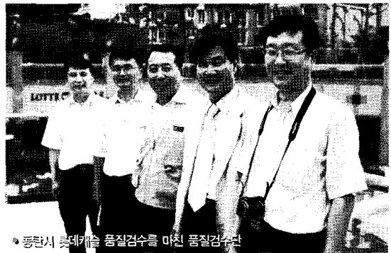
●화성시 롯데캐슬 품질검수를 마친 품질검수단

아파트 품질검수 업무 매뉴얼을 발간해 주택공사, 도시공사, 경기도건축사회 등에도 배포할 정도로 큰 성과를 내고 있는 이 제도는 입주자들로부터 큰 성과를 거둬들이고 있음은 물론 경기도는 아파트 사업계확승인 및 관리·감독 업무에도 이 매뉴얼을 활용하고 있다.