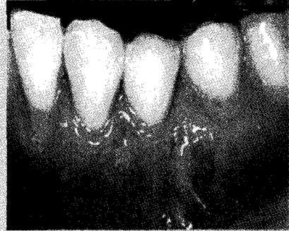
그림 5b. 보철물의 치은변연을 재형성한 후 결합조직이식술을 시행하여 적절한 치관길이를 형성해주었고 적절한 폭의 각화치은을 확보해주어 심미적이고 안정적인 보철물을 만들어주었다(술 후 2년 임상사진).

Reeves는 12) 부착치은이 적거나 없는 경우 치은증강술식 없이는 치은연하 수복물 변연은 비적응증이라고 제시하였다. Orisini 등은 19) 보철물로 수복된 부위에서 유리결합조직이식술로 치은을 증강시킨 경우와 비수술 군을 1년 동안 관찰한 결과 수술군에서 각화치은의 증진과 함께 치주지수가 많이 향상되고 안정적이었으나 비수술군에서는 치은염증지수와 치태지수가 나빠졌음을 보여주었다. 임상증례로서 그림 5a와 같이 얇은 치은을 가진 경우 보철물 하방으로 치은퇴축이 일어나 보철물의 형태가 더 길어졌고 부착치은이 거의 없는 경우였으며 또 다시 보철물을 하더라도 치은퇴축을 막을 수 없었을 것이다. 이런 경우 보철물 변연을 재형성하고 유리 결합조직 이식술을 통하여 각화치은의 폭을 확보하여 더욱 심미적인 결과를 얻을 수 있었고 술 후 2년 후에도 안정적인 보철물과 치은 형태를 유지할 수 있었다(그림 5b).