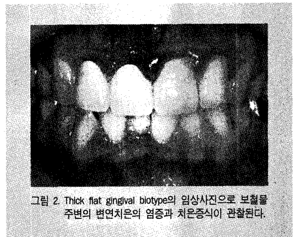
그림 2. Thick flat gingival biotype의 임상사진으로 보철물 주변의 변연치은의 염증과 치은증식이 관찰된다.

이런 분류들은 아직까지는 정량적인 기준이나 근거가 명확하지 않아 주관적인 판단에 의존한다. 치과모형을 이용하거나 ultrasonic device를 이용하여 치은 두께를 측정하는 방법들이 소개되었으며, 박 등은 16) 구강내 인상을 채득하여 3차원 스캐너와 소프트웨어 프로그램을 이용해 측정하여 상악전치부의 papillary area와 임상적 papillary length가