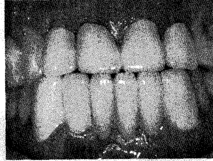
그림 4. 치간부축의 치아의 외형을 따르지 않고 생물학적 폭 경이 침범되어 협축에 치은퇴축이 유발되어 있다.

periodontal biotype을 결정하는 객관적 측정치가 될 수 있다고 제시하였다. 최근에는 Kan 등 17) 이 가장 간단한 방법으로 치은변연에서 periodontal probe의 투과성으로 thin과 thick을 분류하는 방법을 제시하였다.