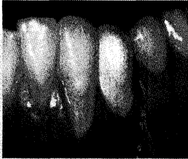
그림 5a. 얇은 치은을 가진 경우 치은퇴축이 발생하여 보철물의 형태가 길어지고 부착치은은 거의 보이지 않게 된다.