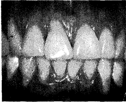
그림 3. Thin scalloped gingival biotype의 임상사진으로 치아의 모양이 triangular 하며 치은이 얇고 부착치은의 폭이 좁고 여러 치아의 치은퇴축이 관찰된다.