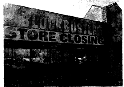
▲ 폐점 배너를 붙인 Blockbuster 매장 모습

- 기존 DVD 대여점에서 신작영화 한 편의 대여비는 5달러 정도로 비싸며 DVD 반납이 늦을 경우 연체료를