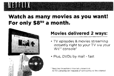
▲Netflix 홈페이지 광고