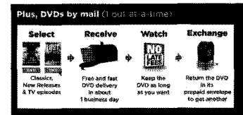
▲Netflix DVD 우편 서비스