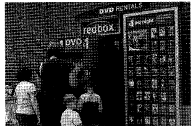
▲Redbox DVD 자판기