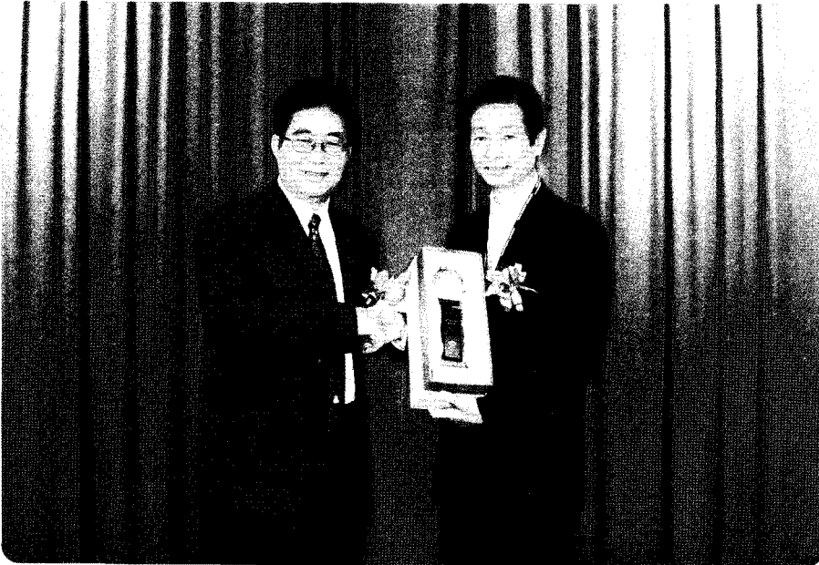
우리회 최종협 부회장 Outstanding Invention Contribution Award 수상

○ 리회는 지난 10월 3일 대만 타이페이세계무역센터에서 폐막된 2010 대만국제발명품전시회에서 (주)씨에 T 이팜의 '아토피 치료용 조성물'을 비롯해 장석중 씨의 '시력회복운동기용 제어장치' 등 4개 출품작이 금 상을 수상했다고 밝혔다.