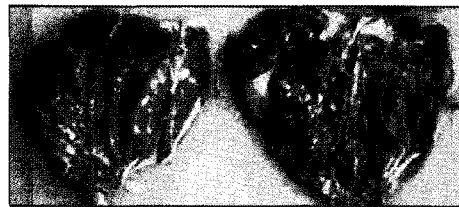
(국내산) 닭고기 (수입산)