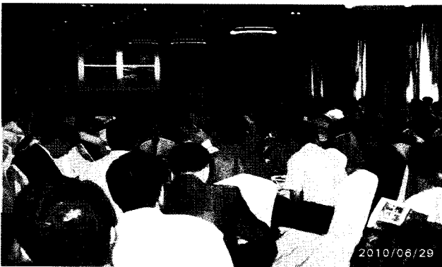
〈제2회 구조안전의 날 주제발표 사진〉