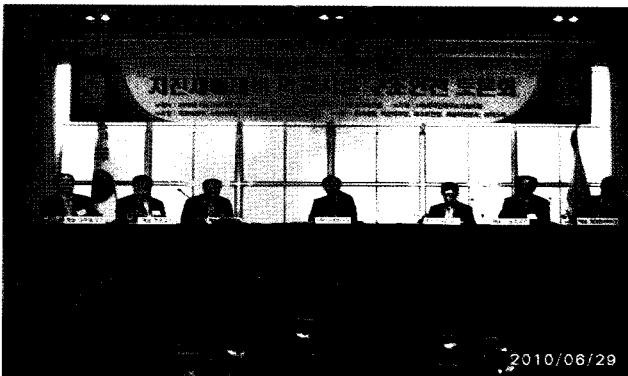
〈제2회 구조안전의 날 토론회 사진〉