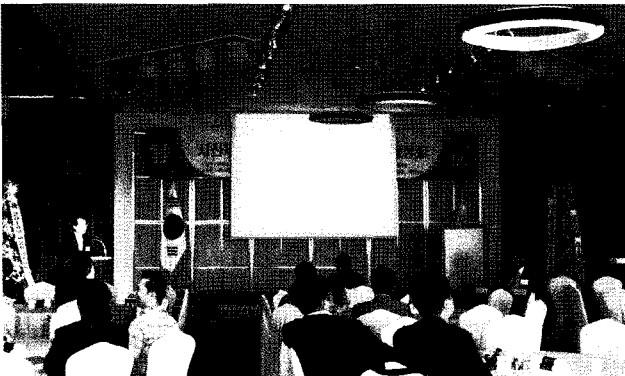
<2010년 제2차 이사회 전경>