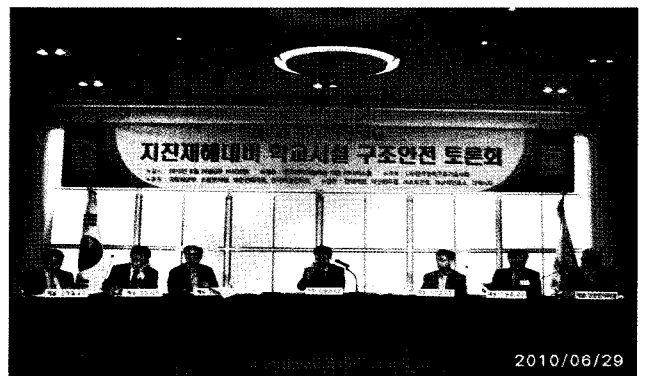
〈제2회 구조안전의 날 토론회 사진〉