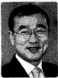
이 상 수 농림수산식품부 동물방역과장

금년 1월 경기도 포천·연천지역에서 구제역이 발생하여 3월 23일 종식을 선언한 이후 4월 8일부터 5월 6일 사이에 인천 강화, 경기 김포, 충북 충주, 충남 청양에서 잇달아 구제역이 발생하였다.