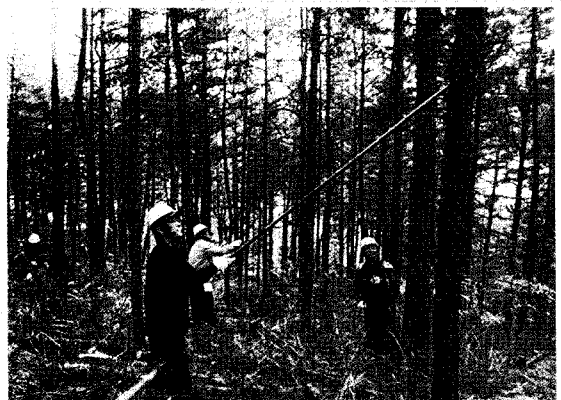
(숲 가꾸기 광경)

산림생태계의 주요 탄소저장고는 나무와 토양입니다. 그러나 숲이 훼손되거나 지구온난화로 인해 지구의 평균기온이 높아지면 나무와 토양에 있는 탄소가 대기 중으로 배출되어 지구온난화가 가속화되나 숲을 잘 가꾸고 보전하면 나무와 토양에 더 많은 탄소를 저장할 수 있게 되므로 지구온난화를 완화시킬 수 있다. 따라서 이를 대응하기 위해서는 우리 산림의 훼손을 억제하고, 훼손지 산림을 복원하고, 산불이나 산사태와 같은 산림재해는 방지해야 되며, 현존 산림을 보전하여 이산화탄소 흡수·저장 능력을 향상시키기 위한 지속가능한 산림경영이 필요하다.