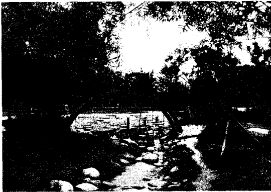
〈도시 숲 풍경〉

도시화율이 90%에 달해 국민의 대부분이 도시에 거주하고 있어 도시환경이 중요한 생활환경으로 여겨짐으로 도시 숲은 국민 모두가 보고, 느끼고, 즐길 수 있는 녹색의 공간을 제공하며, 도시의 푸르름의 생태적인 건강성과 경관미를 향상시키며, 도시별 도시 숲 총량을 산정한 '녹색총량제'를 조속 도입하고 이를 시민들과 더불어 지속적으로 보전·개선되는 방안으로 시스템이 구축되어야 하고, 구체적인 도시 숲 조성 대상지로는 도시공원, 가로수, 학교 숲, 옥상조경, 자투리 땅 녹지조성, 수직정원(vertical garden) 등으로 확대 지정하여 적절한 관리 방안이 마련되도록 정책 및 제도적으로 뒷받침되어야 한다.