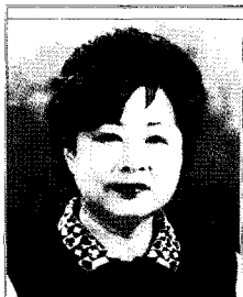
현 성 남 생활요리전문가 플러스현국

일찍 찾아온 더위와 더불어 새벽까지 남아공 월드컵 경기를 응원하느라 체력 소모가 많은 7월.