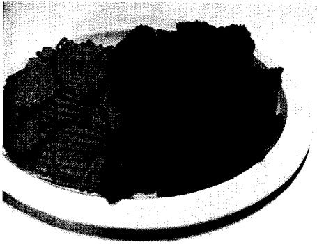
다리살 후라이드로 맛을 낸 '리치텐더'