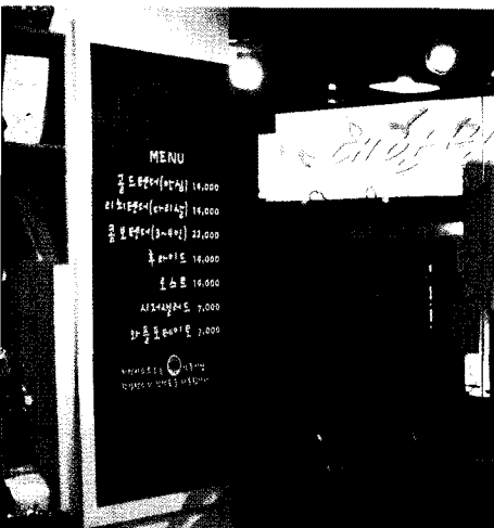
치킨 비스트로 메뉴판