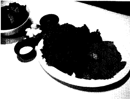
텐더 후라이드에 와플포테이토, 시저샐러드가 어우러진 '커플텐더'