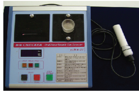
[그림 1] B&B checker기

측정은 3분(호기측정은 30초)동안 입을 다물고 비호흡을 하며 구강 내 가스를 모은 후 측정센서를 구강 내 삼입, 숨을 멈춘 상태에서 15초간 측정한다.