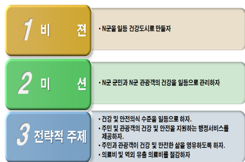
[그림 2] 전략적 주제 설정

두 번째 단계는 N군 건강도시의 발전계획의 기본적인 전략방향을 설정하는 작업으로서 이러한 전략 방향은 기존에 개발되어 있거나 또는 새로이 정립된 N군의 비전(Vision) 또는 사명 선언문(Mission Statement)에 의거하여 설정하였다. 비전 또는 사명은 N군 건강도시 발전계획의 장기적이고 궁극적인 목표이며, 전략적 주제는 이러한 장기 목표에 따라 BSC의 네 가지 관점에서 수립되는 포괄적인 N군 건강도시 발전계획의 기초이며 방향이다. 그림 2는 N군 건강도시 발전계획의 전략적 주제 설정을 자세히 나타낸 것이다.