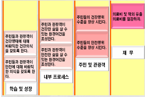
[그림 3] 전략적 목표