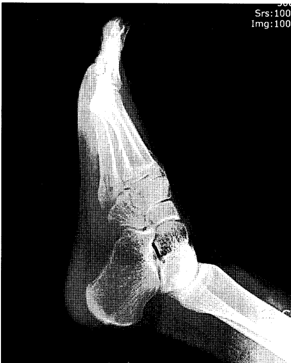
Figure 1. Plain lateral radiograph of left foot shows no bony abnormality.

단되었다(Fig. 4A). 내원 당시 시행한 이학적 검사상 좌측 족저부의 내측 증양면으로 종물이 축지되었으며, 누를 경우 심한 압통을 호소하였다. 피부 발적 및 국소 열감 등의 감염의 증후는 없었고, 통증으로 인한 보행의 장애가 있었으며, 제 2족지부터 5족지까지 족지 굴근의 저하(Grade III)의 약화가 관찰되었다. 시행한 단순방사선에서는 특이소견은 관찰되지 않았다(Fig. 1). 자기공명영상 검사를 시행하였으며 T1 강조 시상면 영상에서 증족부에 장지 굴근 부위에 비교적 균일한 강도의 저신호의 강도를 보이는 종물이 관