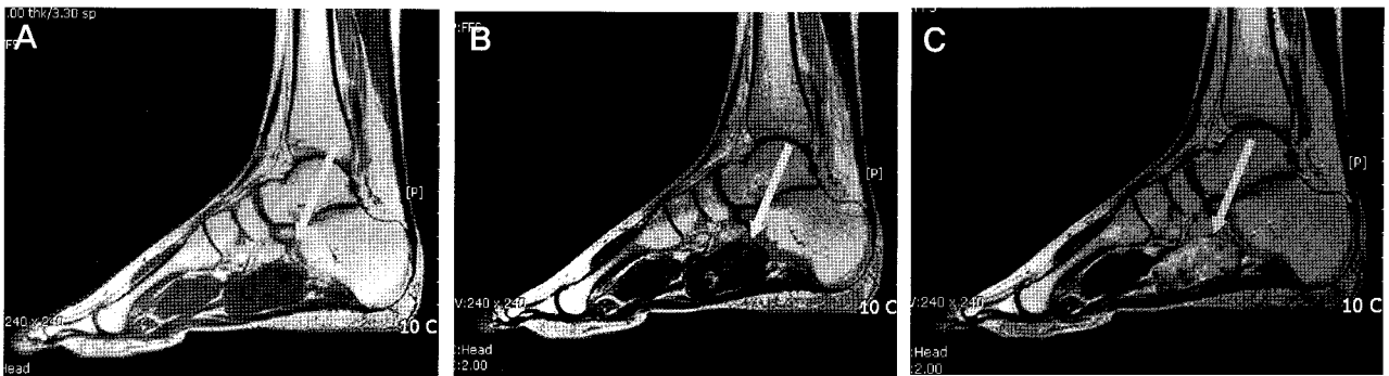
Figure 2. Sagittal MRI of Lt foot. (A) T1 weighted image shows low signal intensity, 3×2×6 cm sized mass along the flexor digitorum longus tendon. (B) T2 weighted image shows high signal intensity which means fluid collection with internal low signal parts in the mass. (C) T1 weighted with enhanced image shows irregular slightly high signal enhancement in the mass.

혈관종은 아직 원인이 밝혀지지 않은 가장 흔한 연부종양의 하나이다. 혈관종은 여성에서 흔히 발생하고 출생 시 또는 어린 연령에서 발생한다. 사지의 심부구조에서 발생하는 혈관종은 주로 근육, 골, 활액막에서 잘 발생하며 슬관절