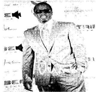
<그림 9> Puff Diddy의 선글라스