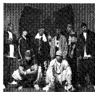
<그림 6> Wu Tang Clan의 우웨어 www.yahoo.com