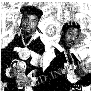
<그림 4> Eric B & Rakim의 고급 악세서리