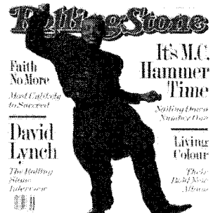
<그림 3> MC Hammer Baggy style www.yahoo.com