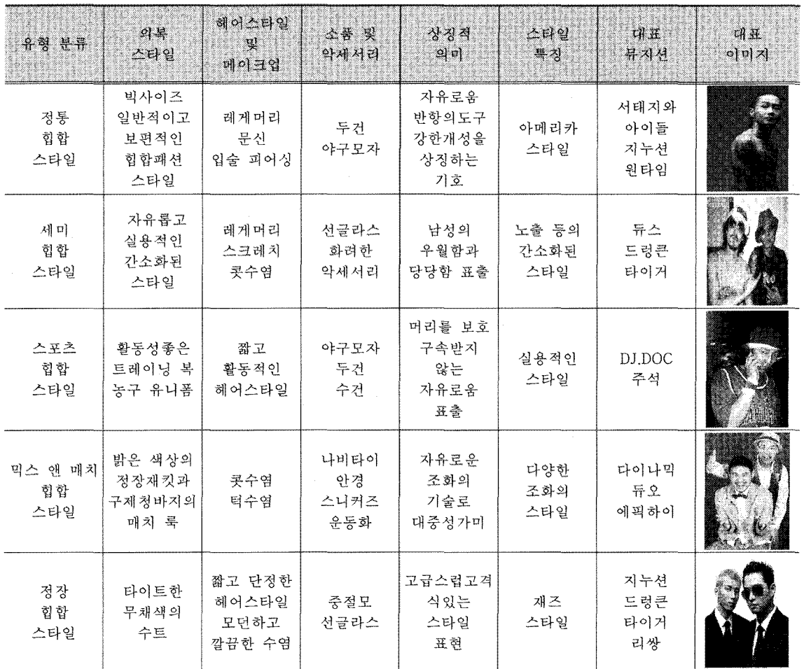
<표 2> 국내 힙합뮤지션의 패션유형별 스타일링

힙합 패션에 있어서 정장 힙합스타일은 재즈스타일에서 유래되었다고 보는데 이는 흑인들이 가지지 못한 부를 과시적으로 표현하려 했던 것에서 부터였다. 힙합 음악에서의 랩퍼 들은 재즈가 가지고 있는 대중성, 정체성 등을 재사용하고자 하였다. 랩퍼에게서 나타나는 재즈 스타일에는 흑인이 미국이란 나라에서 백인과 동화된 외모를 표출하기 위함과 동시에 흑인 고유의 정체성을 드러내려는 욕구가 존재한다.