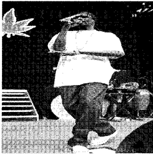
<그림 7> SnoopDoggy Dogg의 긴티셔츠 www.yahoo.com