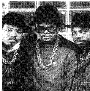
<그림 2> Run-D.M.C 악세서리 www.yahoo.com