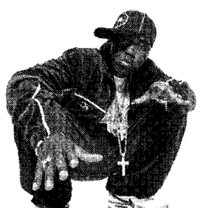
<그림 5> Nas의 십자가 펜던트 www.yahoo.com