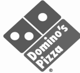
그림 3.1. 도미노 설탕과 도미노 피자

점에서 검토하고 보다 합당한 통계적 접근과 결과를 법조계에 보일 필요가 있는데, 예컨대 다음은 그런 보기들이다.