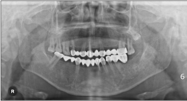
Fig. 5. Mother's panoramic radiograph.