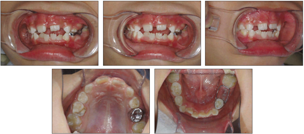
Fig. 2. Clinical photograph.