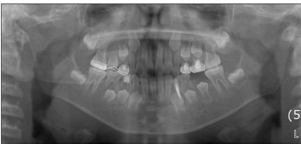
Fig. 4. Follow-up after 14 months.