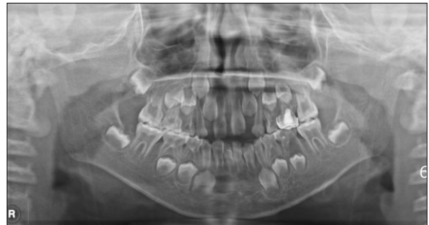
Fig. 1. Initial panoramic radiograph.

이에 본과에서는 심하게 치근 내흡수가 진행된 하악 좌측 제2유구치와 상악 우측 제2유구치는 발거한 후, 공간 유지 장치를 장착하였다 (Fig. 2). 치근단 농양이 형성된 상악 좌측 제1유구치와 하악 좌측 유견치는 치수 절제술을 시행한 후, 유구치는 기성 금속관으로, 유견치는 복합레진으로 수복하였다. 이후 주기적으로 내원하여 불소도포 및 치아 우식증이 없는 건전한 나머지 치아는 치면열구전색술과 같은 적극적인 예방 치료를 시행하고 있다 (Fig. 3, 4).