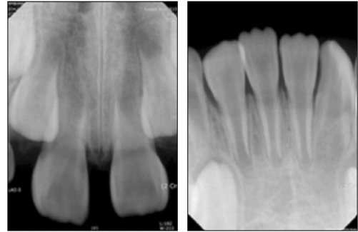
Fig. 6. Permanent teeth.

있다 10-12) . 본 증례의 환아도 어머니가 내반슬을 동반한 저신장과 같은 구루병성 양상을 보였으며, 20대에 치아 우식증이나 치주질환 없이 다수의 치아가 탈락하였다고 하였으며, 치과 방사선 사진 상에서 치아의 형태 이상과 다수의 치아 상실을 관찰할 수 있었다 (Fig. 5). 그러나 환아의 여동생은 전신적으로나 구강 내 소견 상으로 특이 소견은 보이지 않았다.