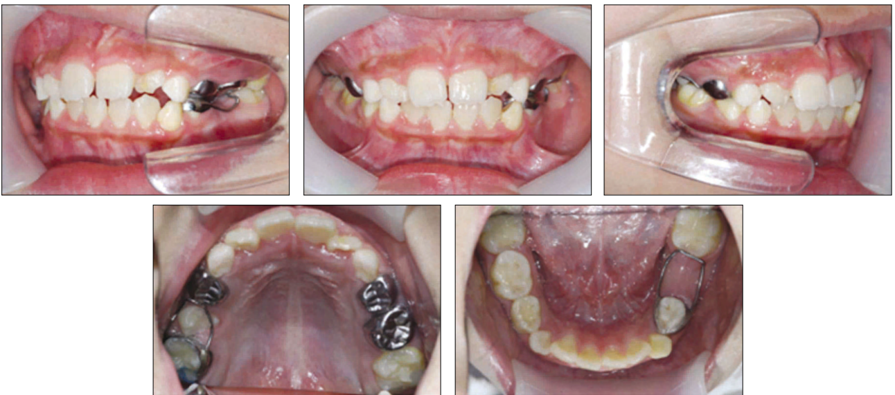
Fig. 3. Follow-up after 12 months.