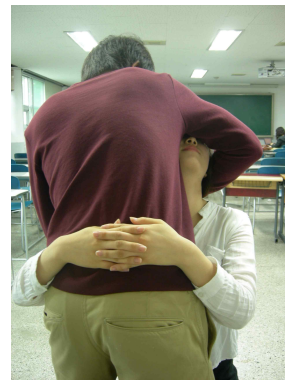
그림 1. Mulligan technique 적용법

아랫에서 촉진되는 첫 번째 돌기이다.)를 감싸서 경부 뒷부분과 접촉하도록 하여 척추를 확실하게 고정한다. 잡는 것은 편안해야 하고 환자를 질식시키지 않도록 주의해야 한다. 상부경추가 이 같은 방법으로 고정되는 동안 머리는 끝범위까지 척추에 대하여 전방으로 당겨지고 거기서 적어도 10초동안 유지한다. 두개골이 움직일 때 치료사는 Facet면이 평행하게 되도록 하기 위해 그것을 기울이지 말아야 한다(Mulligan technique, 1999). 이러한 technique으로 2주간 총 3회 실시하였고, 각 회마다 천천히 8회 적용하였다. (그림1, 2)