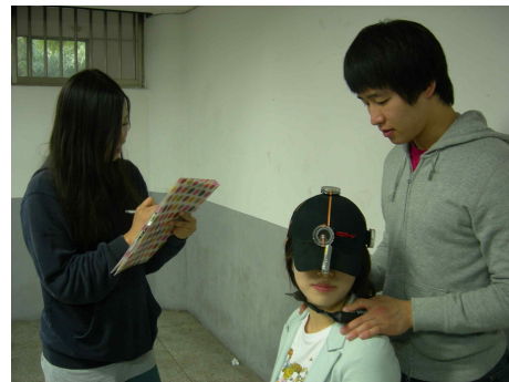
그림 6. Rotation 가동범위 측정

측정자는 대상자의 어깨를 고정시키고, 완전한 경추 Rotation이 될 때까지 머리를 좌우로 돌리게 한 후 측정값을 읽고 기록한다(그림 6).