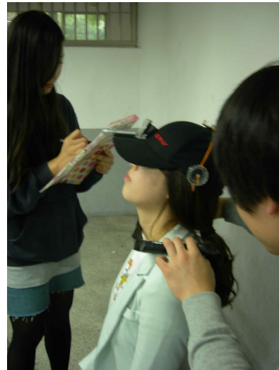
그림 5. Extension 가동범위 측정

측정자는 대상자의 어깨를 고정시키고, 완전한 경추 Extension이 될 때까지 머리를 뒤로 숙이게 한 후 측정값을 읽고 기록한다(그림 5).