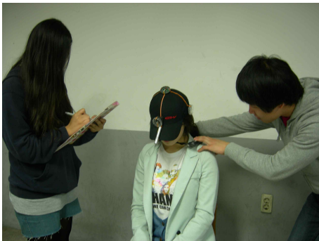
그림 4. Flexion 가동범위 측정

대상자는 상체를 똑바로 세운 상태로 의자에 앉게 한 뒤, 시선은 정면을 향하게 한다. 측정자는 대상자의 어깨를 고정시키고, 완전한 경추 Flexion이 될 때까지 머리를 앞으로 숙이게 한 후 측정값을 읽고 기록한다(그림 4).