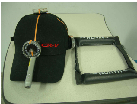
그림 8. LEX

본 연구에서 사용한 도구는 LEX(laser exercise)로 이는 모자에 각도계(중력식각도계와 자기나침의)와 레이저가 부착되어 있는 측정도구이다. LEX는 관절가동범위 측정에 정확성과 신뢰도가 높은 기존의 CROM의 측정방법을 참고로 하여, 일상생활에서 쉽게 사용할 수 있도록 모자의 형태로 만든 측정도구이다(서현규, 2009). Flexion과 Extension, Lateral Flexion은 모자의 좌측과 전면에 부착된 중력식각도계에 의해 측정되었고, 회전 범위는 모자의 상부에 부착된 자기나침의 방식의 각도계에 의해 측정되었다(그림 8).