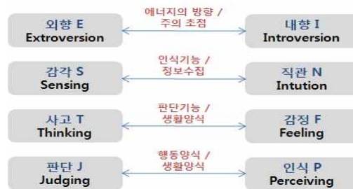
<그림 2> MBTI 네가지 선호경향

MBTI 성격유형은 네 가지의 분리된 지표로 구성되고 각 지표는 기본적인 선호 경향을 가진다. 정보를 수집하고 판단하기 전에 에너지의 방향과 사물이나 문제에 있어 초점을 어디에 두는가에 따라 외향형인지 내향형인지가 구분된다. 그런 후 정보를 수집하는 행동에 따라 감각형과 직관형으로 구분되고, 수집된 정보를 판단하고 결정하는데 있어 사고형인지 감각형인지를 구분한다. 마지막으로 그러한 판단과 결정에 따라 어떻게 행동하고 이행하는가에 따라 판단형과 인식형으로 구분한다. 4가지의 선호성 내용 및 특징을 요약하면 다음과 같다(민정, 2003).