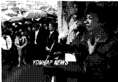
그림 4. 박근혜 테러 관련 UCC[13]

실제 사실을 다큐멘터리 형식으로 보여주되, 편집이나 해당 콘텐츠를 투사하는 조명, 카메라각도, 카메라의 높낮이 등의 기법을 통해 보는 사람들을 진짜 상황 속에 몰입시키는 것과 동시에 시종 무언가를 결정하도록 유도하는 UCC이다. 반복적으로 지속되고 이를 통해 UCC를 시청하는 사람들이 뭔가를 결정해야 함을 교묘하게 내장하고 있다. 편집과 영상기술이 이 UCC에서는 특히 더 많은 힘을 발휘한다. 특정한 인물에 대한 비난을 보다 교묘하게 발전시켜 선거결과에 영향을 미치는 상황을 가정해볼 수 있다.