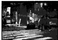
그림 2. 서울역 목도리녀 UCC[13]

이처럼 이슈주도형 UCC는 엄청난 사회적 관심과 압력을 통해 일정한 결과도출까지도 유도하는 효과를 가진다. 선거 시에 이런 이슈주도형 UCC는 상대 후보가 선점하고 있는 이슈를 되찾아오거나 또는 그 자신이 주도함으로써 국민들의 일방적인 관심을 선점할 수 있는 특징을 가진다. 하지만 이슈의 변화 가능성이 너무나 크고 이를 위해 자극적인 소재가 채택될 가능성은 유인폭발형 UCC처럼 크지만 선점효과가 다른 산업이나 분야에 비해 적다는 특징이 있다. 이슈는 항상 변화