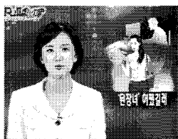
그림 1. 된장녀[13]

유인하고 구체적인 활동을 지시할 수 있는 결집하고 흥분하고 폭발시키는 기능을 수행하는 힘을 가진다.