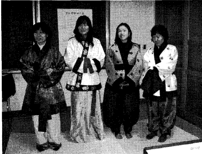
[그림 IV-3] 삼국복식 입어보기

연수 제 3일의 수업은 ‘회화, 유물자료에 나타난 백제복식’, ‘삼국의 복식 이해와 삼국 복식 입어보기’, ‘수업의 실재를 위한 토의’로 구성하였다. ‘회화, 유물자료에 나타난 백제복식’ 수업은 신라나 고구려에 비해 상대적으로 의생활 유물 자료 부