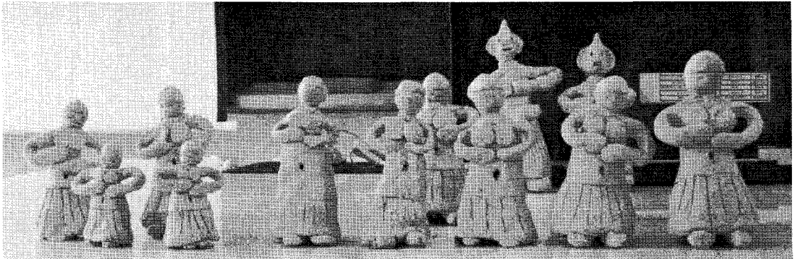
[그림 IV-2] 황토찰흙으로 만든 신라의 토우

연수 제 2일은 ‘한국 고대 복식의 원형’, ‘삼국 복식 디자인’, ‘토용을 활용한 의생활 문화수업’으로 구성하였다. ‘한국 고대 복식의 원형’수업은 고조선과 삼국복식을 중심으로 고대복식에 대한 전문적 이해를 돕도록 프레젠테이션과 함께 강의식 수업이 이루어졌으며, ‘삼국 복식 디자인’수업은 삼국 복식의 특징과 유물 자료를 토대로 복식을 복원 또는 고증하는 과정을 중심으로 강의식 수업이 이루어졌다. ‘토용을 활용한 의생활 문화수업’은 신라의 토용의 복식에서 신라복식의